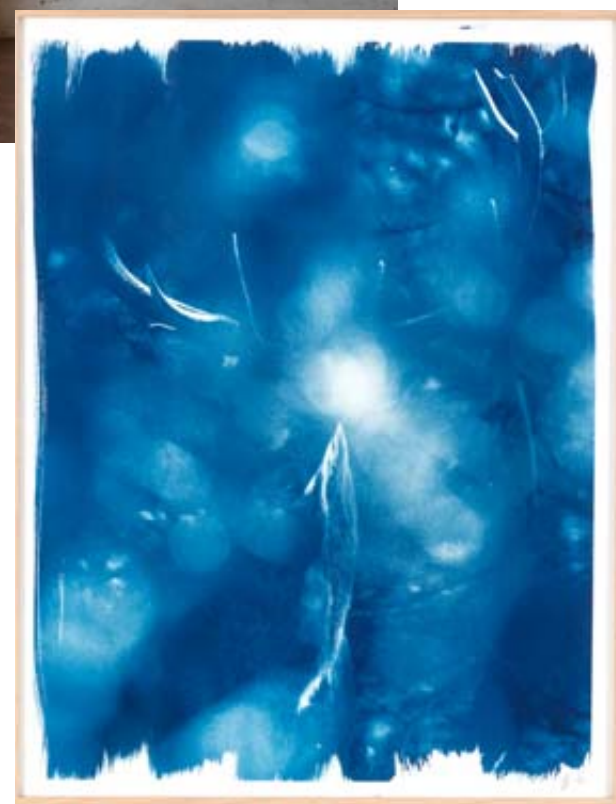
Cervus elaphus 1/6, 2022, cyanotype, sur papier Arches 50x65 cm. FANNY ZAMBAZ

Le site internet de Fanny Zambaz: www.fannyzambaz.ch