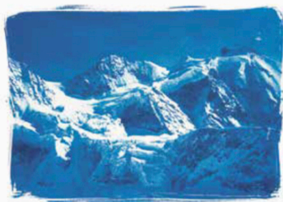
La Valaisanne passe beaucoup de temps à observer la nature, elle apprécie particulièrement la rudesse de l'hiver.

donc pas immortaliser une infinité d'images qu'elle triera plus tard. Tout doit être pensé avant de laisser la lumière pénétrer l'objectif.