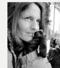
Fanny Zambaz Photographe suisse installée en Valais.

Tétràs lyre cyanotype sur papier Hahnemühle, 50x65 cm